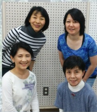
村人・心の精・おんなたち・マサ