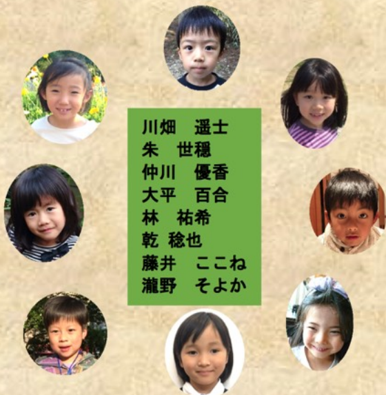
動物・子ども (真生幼稚園児・卒園児有志)