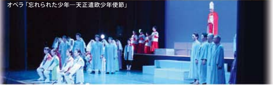
オペラ「忘れられた少年—天正遣欧少年使節」