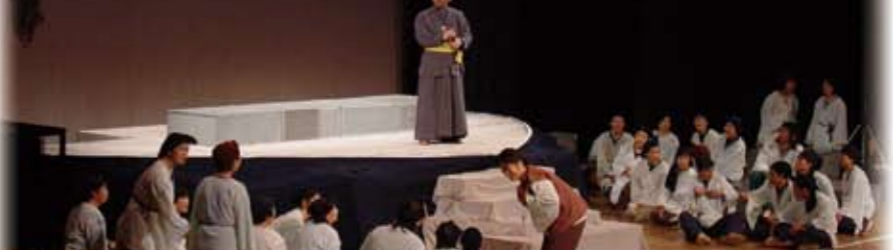
現代歌舞伎版ホームコメディオペラ「フィガロの結婚」